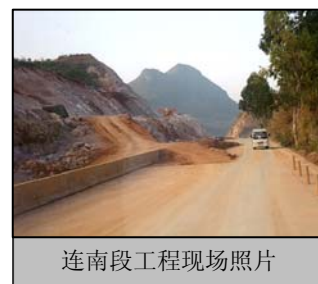
连南段工程现场照片