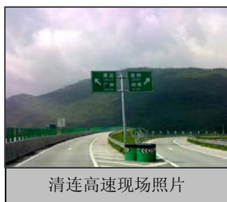
清连高速现场照片

作为活动内容的一部分，我们编制了这份简报，将本次活动中的热点问题加以汇总，以问答的形式呈现给各位投资者，同时，也欢迎各位反馈您的宝贵意见和建议。