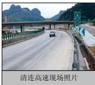
清连高速现场照片